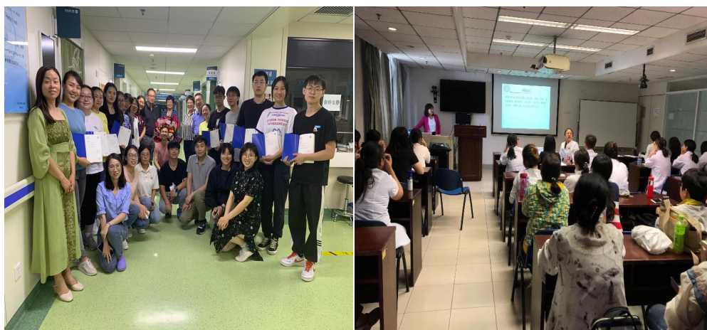
住培学员与导师合影

教研室严格执行住院医师规范化培训标准，按时完成教学查房、小讲课和病例讨论等教学活动。同时为学员提供精彩的全科特色活动，包括定期的学术沙龙、社区联合病例讨论、全科导师授课、演讲比赛以及科研培训等。鼓励学员参与基层实践，在工作中培养对专业的热爱。 始终注重培养住院医自学能力和综合素质的提高。 强调理论与实践相结合，培养规范的全科思维和全面的人文素养。所有住院医在培训过程中将逐步提高临床工作能力，并在结业前具备独立接诊患者、独立解决大部分全科常见疾病的能力，真正实现医学生向医生的华丽转变。