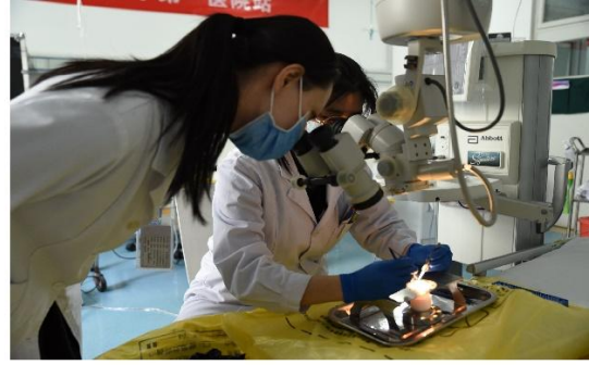
动物眼小梁切除术和白内障超声乳化练习