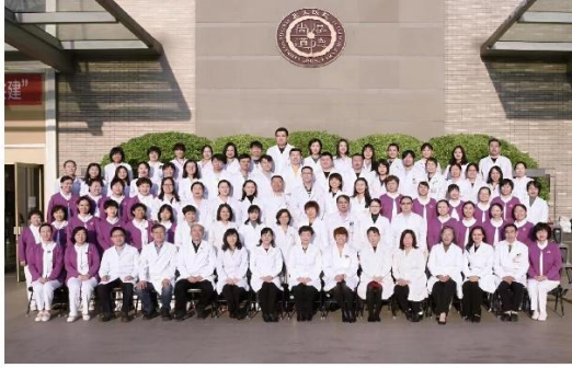
眼科中心全体成员合影