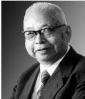
汪绍训教授与广州中山医学院附属医院谢志先教授合作创制了中国人通用的计算“心率面积积分值率”填补了我国空白，被学术界称之为“汪-谢公式”（1956年）。

北京大学第一医院医学影像科是我国最早的医学影像科之一，发展历程可追溯至 1923 年，经历了近百年的建设和发展，已成为专业基础扎实、师资力量雄厚、硬件设备先进、医教研全面发展的综合性医学影像科。是第一批获批住院医师轮转基地，经验丰富。门急诊及住院部检查总量超过 30 万人次/年，病例充足，病种齐全，满足专科培训要求。师资力量雄厚，正高 5 人，副高 10 人，中级 19 人。本专业基地住院医师结业考试多年通过率 100%。住院医师绩效奖金同工同酬，除按照医院相关规定发放固定的基本绩效奖金以外，专业基地会按照工作量给予额外的绩效奖金，夜班费 100 元/次。2022 年计划招录外单位人 2 人、社会人 2 人。