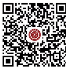
北京大学第一医院支付宝生活号

首次在我院就诊的患者，可通过“北京大学第一医院”微信服务号，或“北京大学第一医院”支付宝生活号，创建我院电子就诊卡进行首次挂号。挂号后，请于就诊当日前，提前到院，须持已备案的“社保卡/医保电子凭证”先到门诊人工收费窗口激活、医保换号，方可进行医事服务费报销，再行就诊，就诊后的处方费用，也须到人工收费窗口进行实时结算缴费。